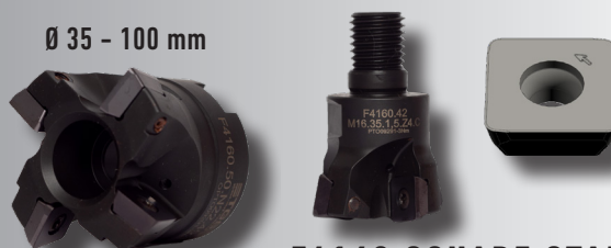
F4160 SQUARE STANDARD