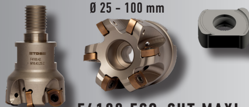
F4100 ECO-CUT MAXI