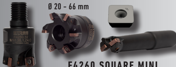
F4260 SQUARE MINI